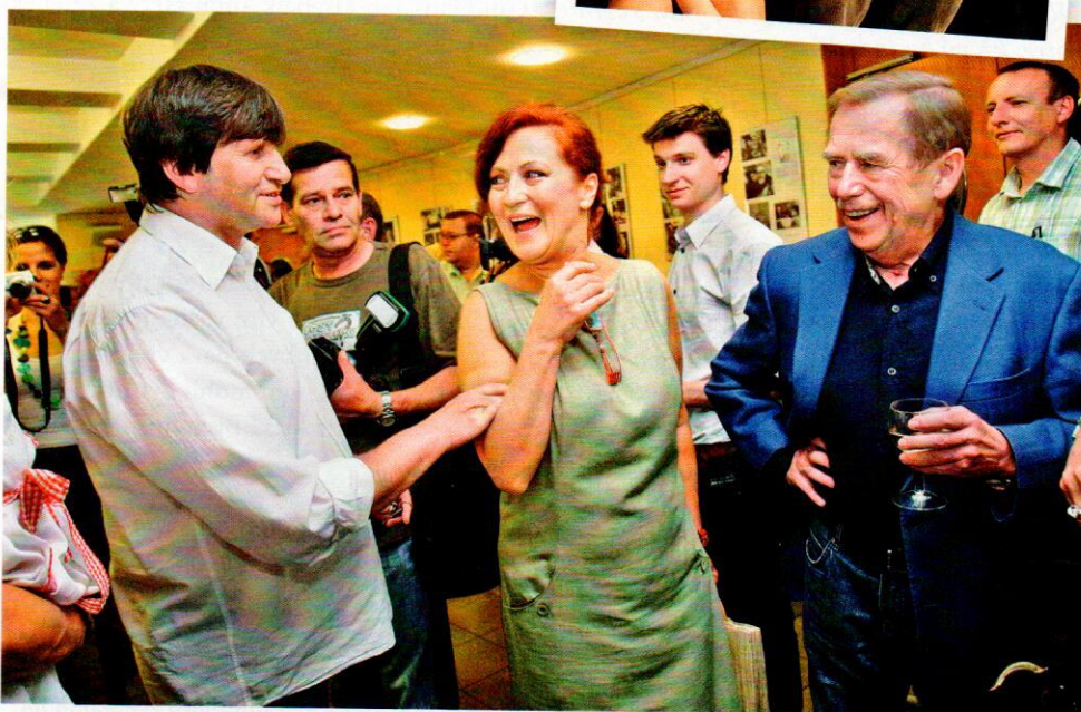
Václava Havla a Simonu Stašovou pozná na fotce z archivu Divadla Na Jezerce jistě každý...

O loňských Vánocích jich bylo v televizi požehnaně. Od konce starých časů, přes Dívku na koštěti, Jak se budí princezny, Lítost,